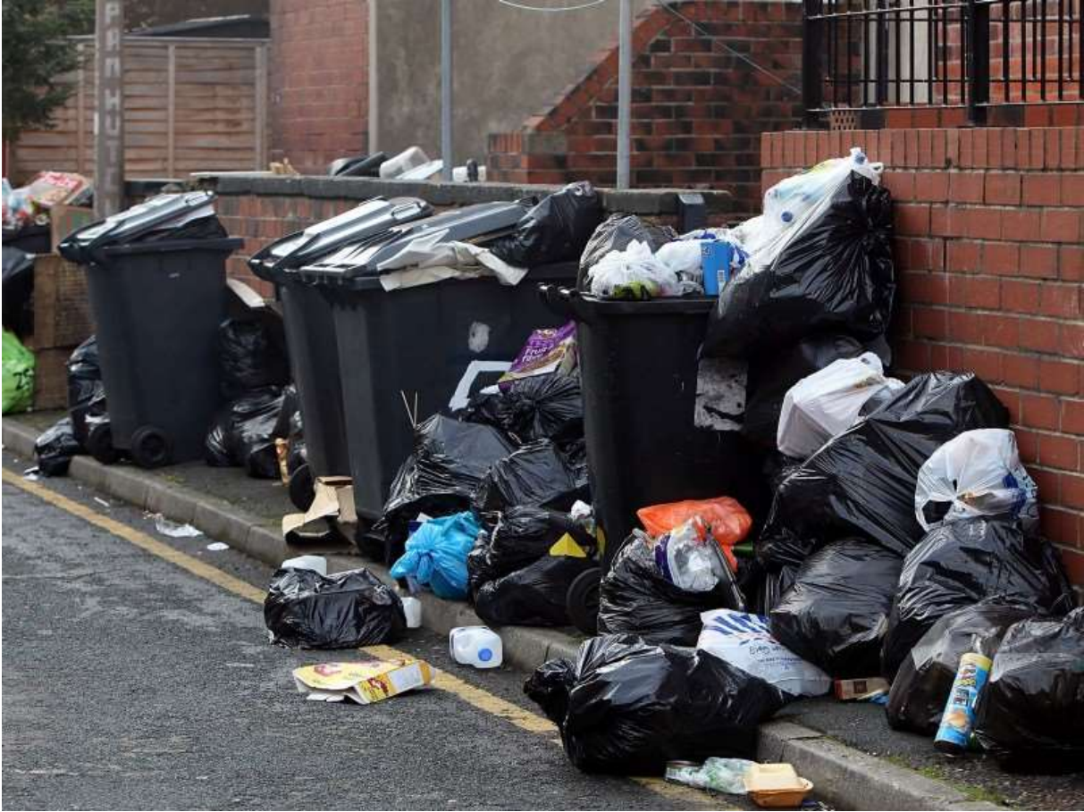
İngiltere’de çöpler.

uzunca yükselen bir duvarın estetik özellikleri beni çarpıyorsa soyut dışavurumculuğu bildiğim içindir. Müzeye bırakılan gözlüğe sanat muamelesi yapacak kadar “ahmaksam” Kavramsal Sanatın dünyayı ele alış şeklini bildiğim içindir. Twitter’da gördüğüm her resmi “Rönesans tablosu” diye etiketliyorsa muğlak ve yanlış da olsa Rönesans tablolarının nasıl olduklarına dair bir inanca sahip olduğum içindir. “Bu iğrenç şey sanat değil” diyebiliyorsa öyle veya böyle bazı nesnelerin sanat olduğuna inandığım içindir. Evimin önündeki çöplerin dağılımı beni sarsıyorsa, iş makinalarını seyre dalıyorsa, bahçıvanın ağaçları budamasını ya da aşçının yemek yapışını performans inceliğinde izliyorsa, kitaplarını Minimalist yapıt edasıyla yana diziyeceklerse, ressamın atölyeleri, sohbetleri ve malzemelerle oynamaları resimlerinden daha çekici geliyorsa bu şekilde bakmayı öğrendiğim içindir. Bu şekilde bakmayı ancak o şeylerin dışında bir şeyle öğrenmiş olabiliriz. Buna sanat dememin hiçbir sakıncası yok. Yani dünya diye bir şeyi beynimde modelleyebilmem için dünya olmayan bir şeye ihtiyacım vardır. Yoksa bir tane dünya olurdu. Ama bir sürü var. Bu nedenle bir dünya ile diğerini ilişkiye sokmaktan başka bir şey yapmıyoruz esasen.