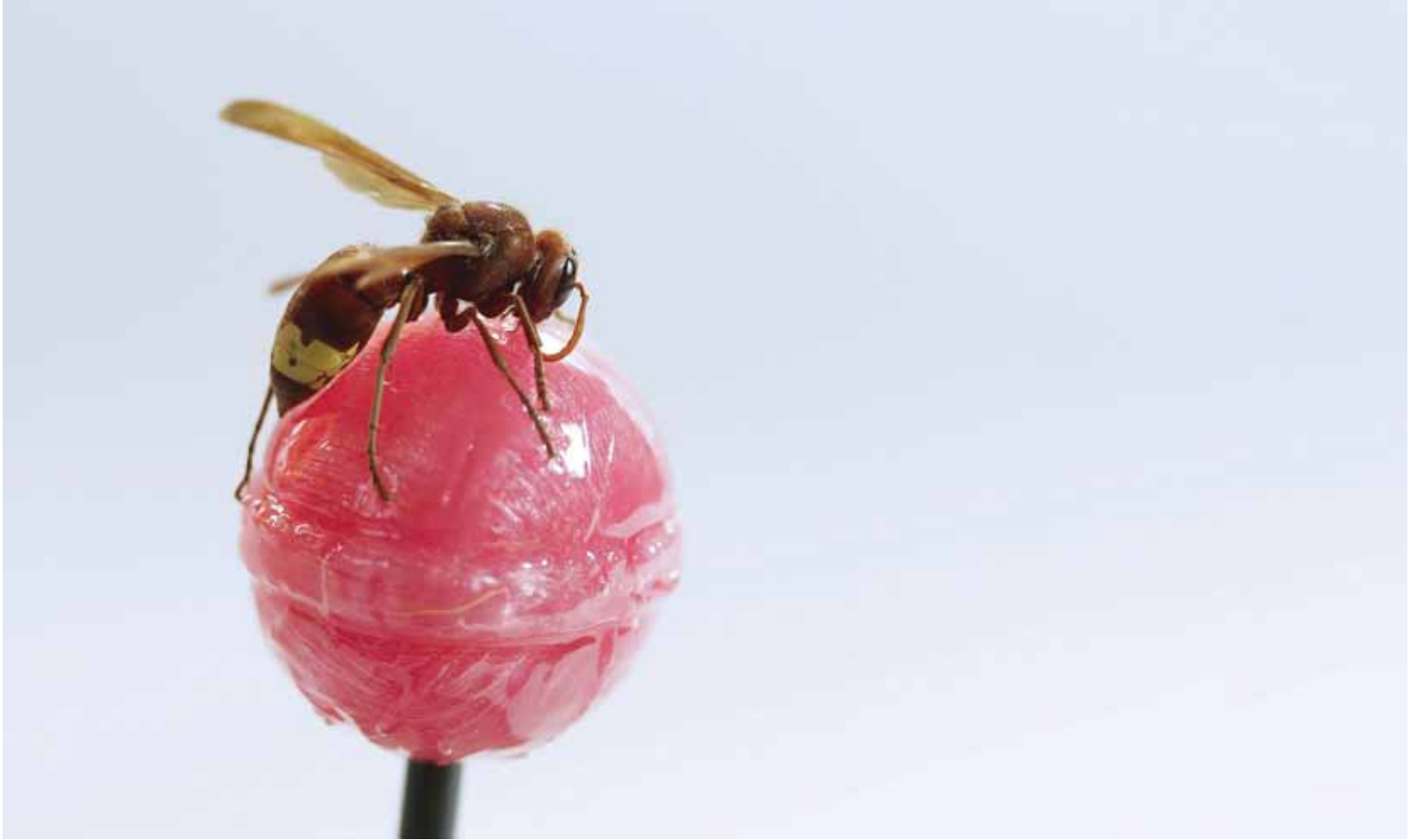
Kerem Ozan Bayraktar, Un video musicale per un Requiem / A music video for a Requiem , 2014, video, 2'14"